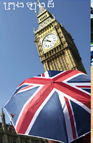
ក្រុងឡុងដ៍

ជួបជុំគ្នាញ៉ាំអាហារពេលល្ងាចតាមបែបត្រួសារ ជំរកកំសាន្តសប្បាយជាមួយគ្នារហូតដល់ពាក់កណ្តាលអធ្រាត្រ គឺជាទំនៀមទំលាប់ប្រពៃណីនៃការប្រារព្ធពិធីបុណ្យចូលឆ្នាំថ្មីនៅប្រទេសអេស្ប៉ាញ ទីក្រុងម៉ាឌ្រីដដែលត្រូវបានប្រជាជនរក្សាទាំងពីរបុរាណកាលរហូតមកដល់ពេលបច្ចុប្បន្ន ។ ការរង់ចាំរហូតដល់ពាក់កណ្តាលអធ្រាត្រនេះ គឺរង់ចាំស្គរសំលេង កណ្តឹងទាឡិកាហោម ។ មនុស្សទាំងអស់ត្រូវស្តាប់កាំត្រូវឮរំលោភទាំងបាញ់ជូរជូរបាន 12 ផ្លែ ។ ទាឡិកាហោមមួយប៉ុន្មានផ្លែ ញ៉ាំរហូតទាល់តែអស់ 12 ផ្លែ ទើបទទួលបាននូវភាពសុខសប្បាយនៅឆ្នាំថ្មីបន្ទាប់ពីនោះមកទើបម្នាក់ៗអាចទាំគ្នាទេញទៅកំសាន្តនៅខាងក្រៅបាន ។ នេះគឺជាទំនៀមទំលាប់មួយ ដែលមានលក្ខណៈខុសប្លែកពីគេ ។