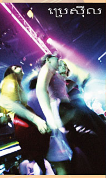
ប្រេស៊ីល

នៅក្នុងទីក្រុងឡុងដ៍ប្រទេសអង់គ្លេស ប្រជាជននៅទីនោះប្រារព្ធពិធីបុណ្យចូលឆ្នាំថ្មី ដោយបានជួបជុំគ្នា រៀបចំពិធីដំបូងនៅទីលំនៅមុខទាឡិកា Big Ben ដ៏ធំ ដើម្បីរង់ចាំទ្រទិចទាឡិកាវិភិលដល់ម៉ោង 12 ពាក់កណ្តាលយប់ ។ នៅពេលសល់ 10 វិនាទី នឹងចូលវិនាទីឆ្នាំថ្មី ម្នាក់ៗត្រូវរាប់លេខថយក្រោយខ្លាំងៗ ពី 10 មកដល់ 1 ។ នៅពេលសល់លេខ 0 សូរស័ព្ទមកស្រែកថា សួស្តីឆ្នាំថ្មី បានលាមិញទ្រហឹងអីងកង ឯសូរកាំជ្រួតក៏ចុះព្រមជាមួយគ្នានោះដែរ ។