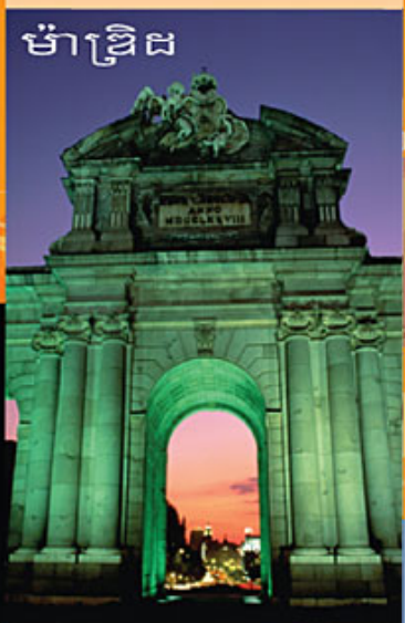
ម៉ាឌ្រីដ

នៅក្នុងទិសបុណ្យចូលឆ្នាំសកលនេះ Cellcard និងរៀបចំពិធីដំបូងមួយដំបូងនៅក្នុងទីក្រុងភ្នំពេញ ដើម្បីអបអរសាទរការបើកទំលើឆ្នាំថ្មី ឆ្នាំ 2007 ។ សូមអានអត្ថបទពិមានខាងក្រោម ដើម្បីចូលរួមពិធីដំបូងអបអរសាទរឆ្នាំថ្មីជាមួយ Cellcard ។