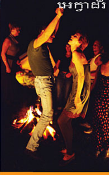
អេក្វាដ័រ

មនុស្សជាង 2 លាន នាក់បានមកជុំគ្នានៅលើឆ្នេរសមុទ្រ Copacabana រៀបចំពិធីដំបូងមួយនៅទីនោះ ដើម្បីរង់ចាំឆ្នាំថ្មី ។ ញ៉ាំម្ហូបផ្សេងៗ រំលងកំសាន្តក្រៃលែង ចម្រុះតាមបែបប្រេស៊ីល ភាពសប្បាយរីករាយកើតមានតាំងព្រលប់រហូតទល់ភ្លឺនៅថ្ងៃទី 31 ខែធ្នូ ឈានចូលថ្ងៃទី 1 ខែមករា ។